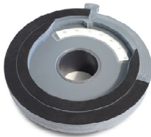
Ansicht von unten

Durch Eigengewicht gehaltener, regulierbarer Drosselaufsatz