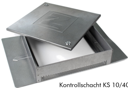
Kontrollschacht KS 10/40