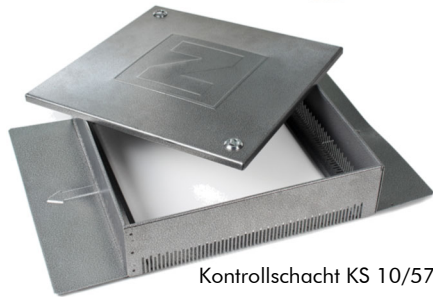
Kontrollschacht KS 10/57