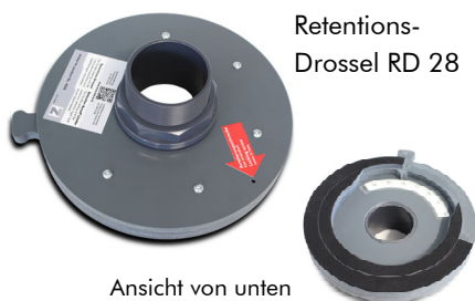
Retentions-Drossel RD 28