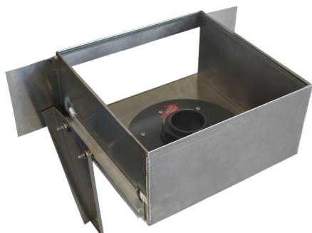
Randübergabeschacht aus Aluminium zum Einbau am Tiefgaragenrand und Aufnahme der Retentionsdrossel RD 28